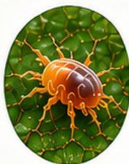
CALIFORNICUS GEGEN SPINNMILBEN

Cucumeris cucumeris jagt und frisst Thripse (Larven und adulte Tiere).