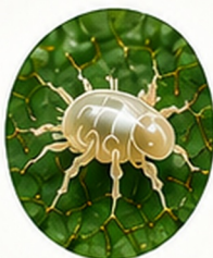
CUCUMERIS GEGEN THRIPSE

Raubmilben sind natürliche Nützlinge, die gezielt nach Schädlingen suchen und diese aktiv bekämpfen. Sie ernähren sich außerdem von Pollen und tragen so zur Gesunderhaltung Deiner Pflanzen bei – ganz ohne chemische Mittel.